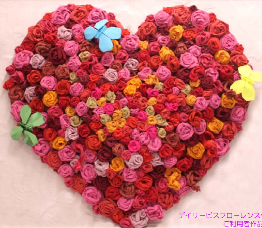
デイサービスフローレンスケア横浜森の台 ご利用者作品